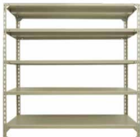
※1800H×1500W×600D 5段の場合の完成図画像です。